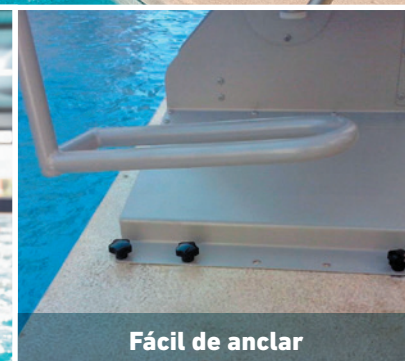
Fácil de anclar